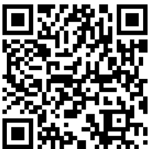
Spacer z Jaśkiem pod Śnieżnicą

Ułatwieniem są również kody QR dla każdej wyprawy opublikowane w ulotce, w której zbiera się korale oraz na każdej ulotce questowej. Można je również zeskanować tutaj: