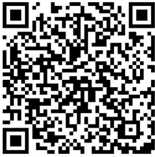
Baza Lubo Gości