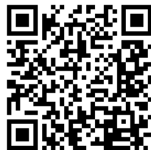
Śladami Piewcy Gorców